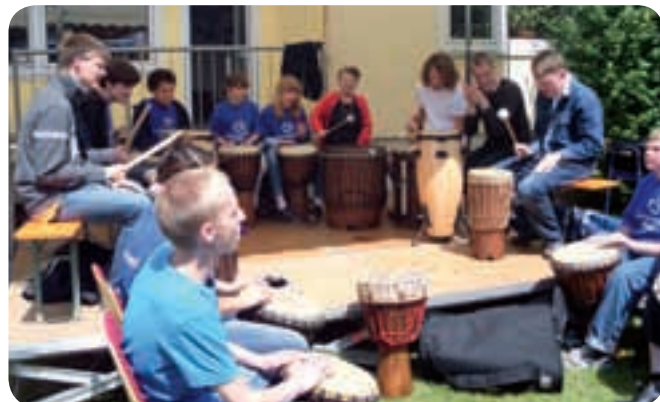
Auftritt beim Gartenfest

Aus der Trommelgruppe II ist mittlerweile die Gruppe „Move of live“ entstanden, die bei verschiedensten Festen der Lebenshilfe und Veranstaltungen in der Stadt ihre Auftritte hat.