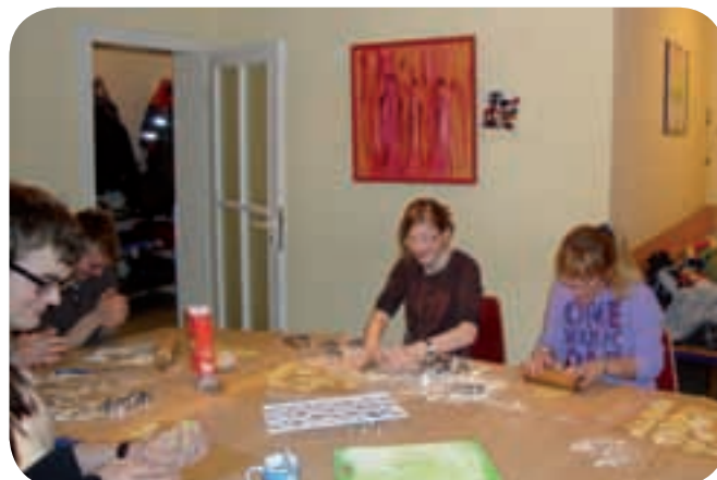
Hobbybäcker am Werk