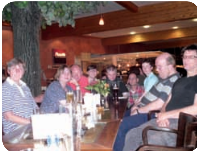
Ausflug in die „Neue Schmiede“ nach Bielefeld - Ein Freund III