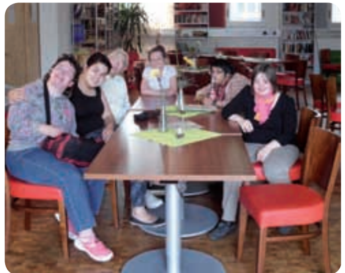
Immer wieder gerne: Besuch im E-Werk

Bei einer leckeren Tasse Kaffee und Kuchen können die Teilnehmerinnen den Arbeitstag hinter sich lassen und gemeinsam den weiteren Nachmittag planen. Es wird gemeinsam gebacken, gekocht und gebastelt. Stadtbummel, interessante Ausflüge und Messebesuche runden das Programm ab