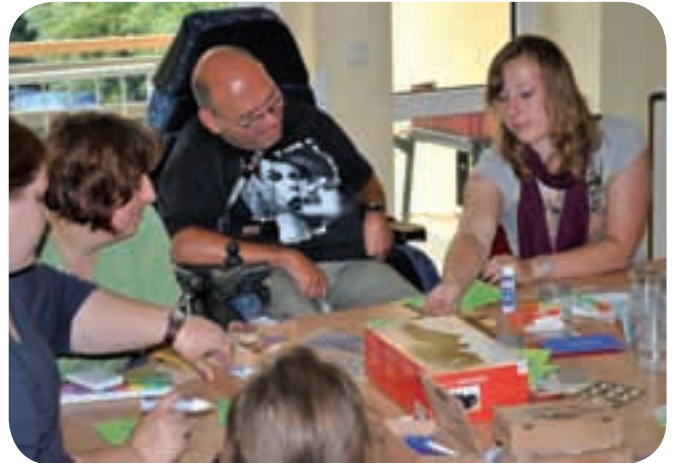
Grußkartenbasteln - der nächste Anlass kommt bestimmt