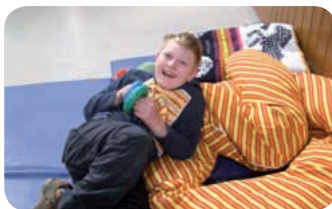
Entspannen und genießen