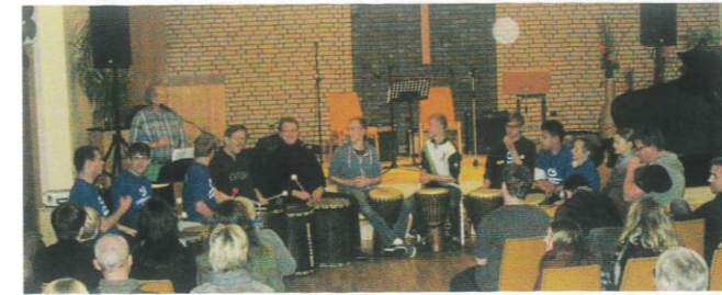
Auftritt beim Benefizkonzert

Dass unsere Trommelgruppe „Move of Life“ großartig ist steht ausser Frage!