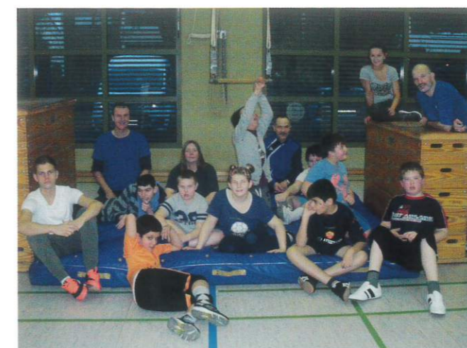
Die ganze „Dienstagsturntruppe“ auf einem Blick

Zeit: wöchentlich dienstags 15.30 – 17.30 Uhr Ort: Turnhalle der Wichernschule, Goebenstr. 30, Minden Leitung: Lars Gräber Kursgebühr: 45,- €